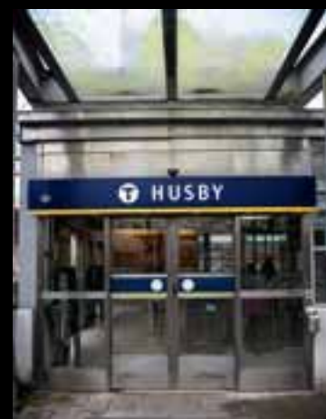
Husby tunnelbanestation.